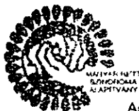
László Tímea Kuratóriumi tag

Cím: 1116 Budapest Sáfrány u. 42. Tel: 061-784-20-17 Mobil: 06-20-542-71-28 Adószám: 18075618-1-43